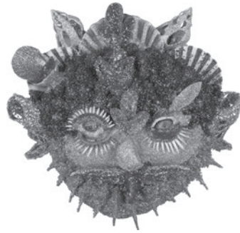
3 PAUL AMAR SEM TÍTULO / UNTITLED, n.d. Conchas, búzios, verniz e purpurinas / Shells, whelks, varnish and glitter