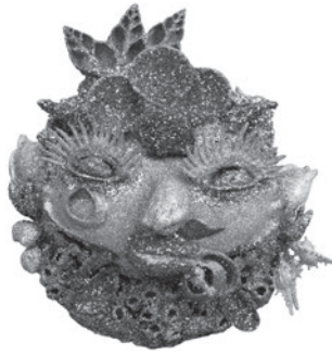
2 PAUL AMAR SEM TÍTULO / UNTITLED, n.d. Conchas, búzios, verniz e purpurinas / Shells, whelks, varnish and glitter