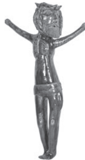
78 ROSA RAMALHO SEM TÍTULO / UNTITLED, c. 1960 Barro cozido e vidrado / Fired and glazed clay