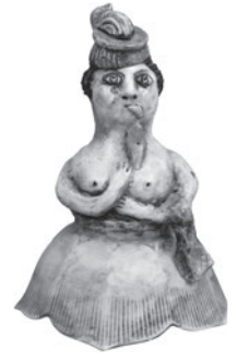
35 REINALDO ECKENBERGER LADY PATHOS, n.d. Cerâmica pintada / Painted ceramic