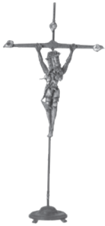
40 LIONEL SAINT ELOI SEM TÍTULO / UNTITLED, n.d. Ferro, alumínio, arame e vidro / Iron, aluminium, wire and glass