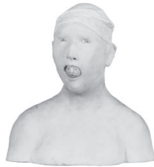
13 AGNÈS BAILLON FEMME CANIBALE, 2002 Resina / Resin