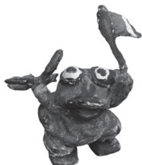
56 JABER (AL-MAHJOUB JABER) SEM TÍTULO / UNTITLED, 1981 Acrílico e papel machê / Acrylic and papier-mâché