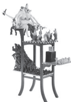
53 BLALLA W. HALLMANN SOMETIMES I THINK, I AM KNOCKING AT HEAVENS DOOR (SCHWEINCHENALTAR), 1984 Madeira, acrílico e papel machê / Wood, acrylic and papier-mâché