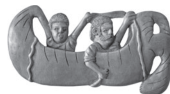
63 NACIUS JOSEPH SEM TÍTULO / UNTITLED, 1978 Madeira / Wood