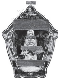
77 GIOVANNI BATTISTA PODESTÀ SEM TÍTULO / UNTITLED, n.d. Técnica mista / Mixed media