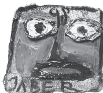
60 JABER (AL-MAHJOUB JABER) SEM TÍTULO / UNTITLED, 1998 Acrílico e gesso sobre papel / Acrylic and plaster on paper