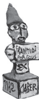
61 JABER (AL-MAHJOUB JABER) SEM TÍTULO / UNTITLED, 1982 Acrílico e gesso / Acrylic and plaster