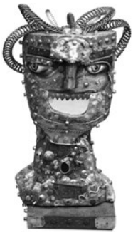
20 VITALIS ČEPKAUSKAS SEM TÍTULO / UNTITLED, 2002 Objetos recuperados e madeira pintada / Recovered objects and painted wood