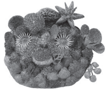
4 PAUL AMAR SEM TÍTULO / UNTITLED, n.d. Conchas, búzios, verniz e purpurinas / Shells, whelks, varnish and glitter