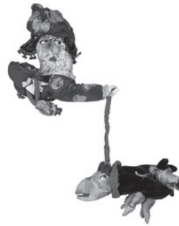
38 REINALDO ECKENBERGER PARISIENNE OPÉRÉE AUX SACRÉ COEUR, n.d. Tecido estofado / Upholstery fabric