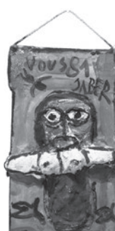
54 JABER (AL-MAHJOUB JABER) SEM TÍTULO / UNTITLED, 1981 Acrílico e gesso sobre madeira / Acrylic and plaster on wood