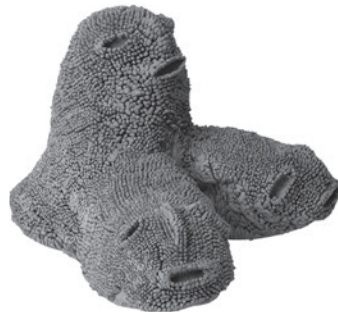
65 KAZUMI KAMAE ME AND MASATO GOING TO THE SWIMMING POOL AND PUTTING ON SWIMMING SUITS, 2018 Argila / Clay