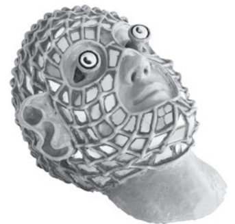
47 AD))) MICHEL GOUÉRY SEYMOUR, 2008 Cerâmica, cimento e espelhos / Ceramic, concrete and mirrors