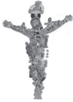
33 JEAN DURANEL SEM TÍTULO / UNTITLED, n.d. Cerâmica pintada e espelho sobre madeira / Painted ceramic and mirror on wood