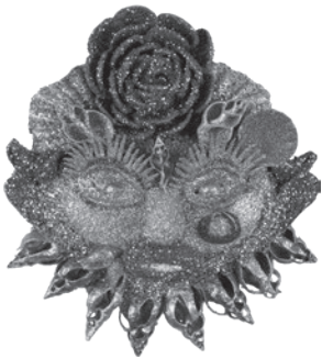
5 Paul Amar LES FOLIES BERGÈRES, n.d. Conchas, búzios, verniz e purpurinas / Shells, whelks, varnish and glitter