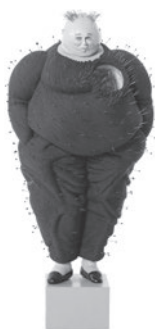
49 MOZART GUERRA GABRIEL, 2004 Resina, poliestireno, fios de cobre, cordas e alfinetes / Resin, polystyrol, copper cables, ropes and pins