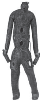
6 ANÔNIMO / ANONYMOUS OS GUERREIROS BIZANGO / THE BIZANGO WARRIORS) SEM TÍTULO / UNTITLED, n.d. Técnica mista / Mixed media