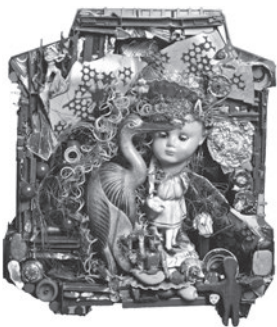
44 SIMONE LE CARRÉ-GALLIMARD SEM TÍTULO / UNTITLED, n.d. Metal, plástico e objetos recuperados / Metal, plastic and recovered objects