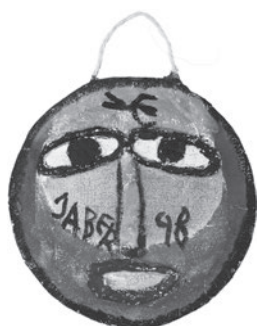
57 JABER (AL-MAHJOUB JABER) SEM TÍTULO / UNTITLED, 1988 Acrílico e papel machê / Acrylic and papier-mâché