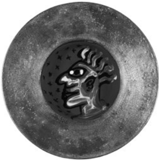
88 HANS VERSCHOOR SEM TÍTULO / UNTITLED, 2010 Cerâmica pintada / Painted ceramic