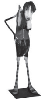
43 LA MÈRE FRANÇOIS SEM TÍTULO / UNTITLED, n.d. Técnica mista / Mixed media