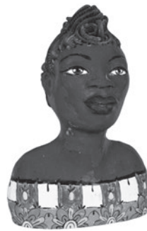
10 MAUREEN VISAGÉ MEDUSA, 2015 Terracota pintada / Painted terracotta