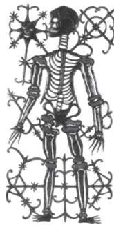
9 JOHN SYLVESTRE SEM TÍTULO / UNTITLED, n.d. Metal martelado / Hammered metal