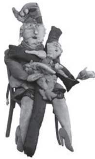
37 REINALDO ECKENBERGER SOMETIMES I FEEL LIKE A CRUCIFIED CHILD, n.d. Tecido estofado e cadeira de madeira / Upholstery fabric wooden chair