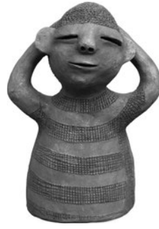
82 REINATA SADIMBA SEM TÍTULO / UNTITLED, n.d. Barro e grafite / Clay and graphite