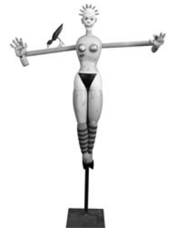
27 PIERRE DESSONS CHRISTESSE, 2006 Madeira pintada, ferro e objetos recuperados / Painted wood, iron and recovered objects