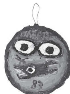
55 JABER (AL-MAHJOUB JABER) SEM TÍTULO / UNTITLED, 1983 Acrílico e gesso sobre madeira / Acrylic and plaster on wood