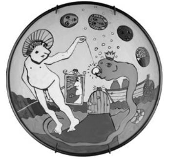
87 HANS VERSCHOOR SEM TÍTULO / UNTITLED, 1993 Cerâmica pintada / Painted ceramic