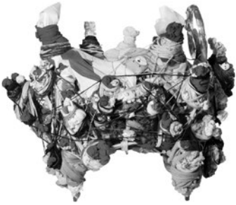
84 PASCAL TASSINI SEM TÍTULO / UNTITLED, 2012 Assemblagem têxtil e objetos recuperados / Textile assemblage and recovered objects