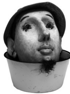
22 JEAN-JULES CHASSE-POT (PAUL RANCILLAC) IL N'A PAS PERDU SON CHAPEAU, n.d. Pasta de papel, resina, vidro e objetos recuperados / Paper pulp, resin, glass and recovered objects