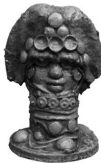
29 MIRABELLE DORS SEM TÍTULO / UNTITLED, n.d. Resina e materiais recuperados / Resin and recovered materials