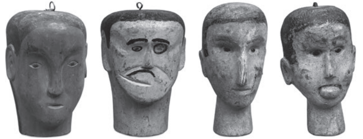
7 ANÔNIMO / ANONYMOUS (Ex-votos Brasil) SEM TÍTULO / UNTITLED, n.d. Madeira esculpida e pintada / Carved and painted wood