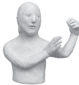
14 AGNÈS BAILLON JÉSUS SE DÉTACHANT DE LA CROIX, 2009 Resina / Resin