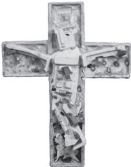
72 MARTINE ORSONI SEM TÍTULO / UNTITLED, 1987 Técnica mista / Mixed media