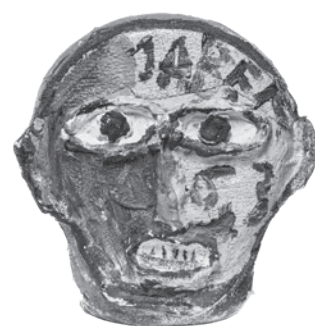
59 JABER (AL-MAHJOUB JABER) SEM TÍTULO / UNTITLED, 1963 Acrílico e gesso sobre barro / Acrylic and plaster on clay