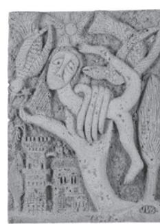
46 JOAQUIM VICENS GIRONELLA LA MAIN QUI ENTRENT, 1980 Cortiça sobre madeira / Cork on wood