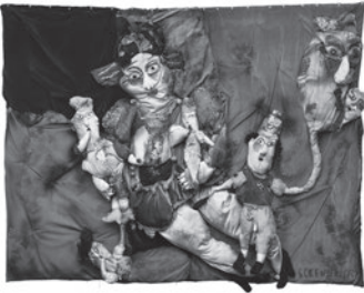
36 REINALDO ECKENBERGER MOLAMBOFILIA II, n.d. Tecido estofado / Upholstery fabric