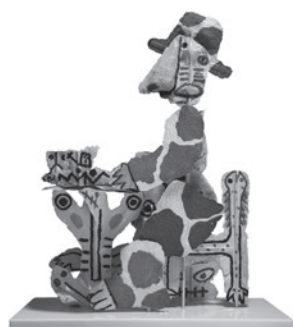
52 JOSÉ DE GUIMARÃES FERNANDO PESSOA, 1985 Pasta de papel policromada, vidro moído e espelhos / Polychromed papier-mâché, ground glass and mirrors