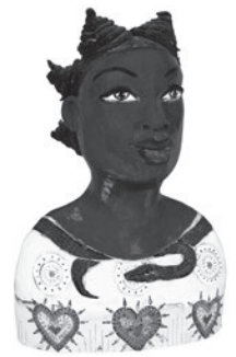
11 MAUREEN VISAGÉ MEDUSA, 2015 Terracota pintada / Painted terracotta