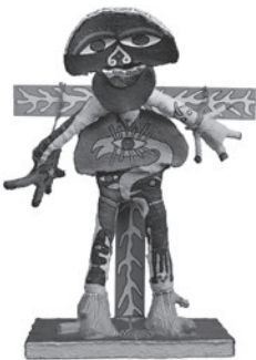
12 JOAQUIM BAPTISTA ANTUNES SEM TÍTULO / UNTITLED, 1990–2006 Madeira pintada / Painted wood