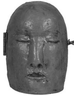
86 TERRY TURRELL QUEEN OF HEARTS, 2008 Madeira pintada, ferro e objetos recuperados / Painted wood, iron and recovered objects