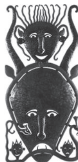
62 SERGE JOLIMEAU TOTEM AUX DEUX TÊTES, 1999 Metal martelado e cadeado / Hammered metal and padlock