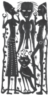
8 AD))) GABRIEL BIEN-AIMÉ MÉTAMORPHOSE 2, n.d. Metal martelado / Hammered metal