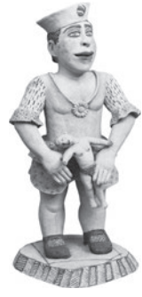
75 NILI PINCAS FILLE À LA POUPÉE, 1990 Terracota engobada / Engobed terracotta