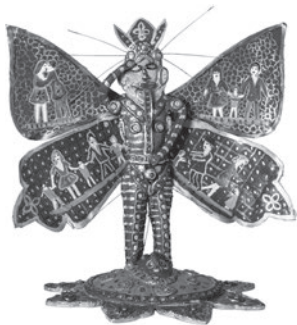
76 GIOVANNI BATTISTA PODESTÀ L'HOMME DE L'AN 2000, n.d. Técnica mista / Mixed media