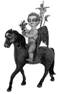
83 ANTÓNIO SAINT SILVESTRE L'ANGE DE L'APOCALYPSE, 2006 Técnica mista / Mixed media