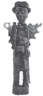
71 JEAN CAMILLE NASSON SEM TÍTULO / UNTITLED, n.d. Madeira, metal e materiais recuperados / Wood, metal and recovered materials