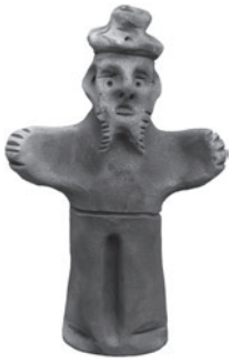
1 ADÉRITO ALMEIDA SEM TÍTULO / UNTITLED, 2016 Barro preto / Black clay