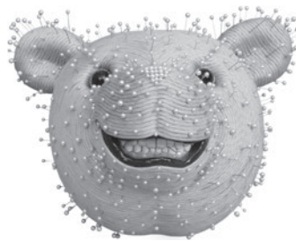
50 MOZART GUERRA SEM TÍTULO / UNTITLED, 2003 Poliestireno, cordas, alfinetes, papel machê e acrílico / Polystyrol, ropes, pins, papier-mâché and acrylic