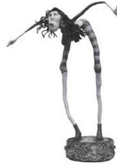
42 LA MÈRE FRANÇOIS SEM TÍTULO / UNTITLED, n.d. Gesso pintado e objetos recuperados / Painted plaster and recovered objects