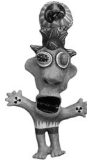
90 WABÉ (VÉRONIQUE ACHARD) LE PETIT CHRIST DE FUKUSHIMA, 2013 Técnica mista / Mixed media