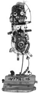
16 VITALIS ČEPKAUSKAS SEM TÍTULO / UNTITLED, n.d. Objetos recuperados e madeira pintada / Recovered objects and painted wood