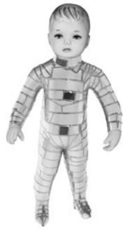
21 XURXO ORO CLARO SEM TÍTULO / UNTITLED Da série / From the series Niños, 2007 Aço inoxidável e resina de poliéster / Stainless steel and polyester resin