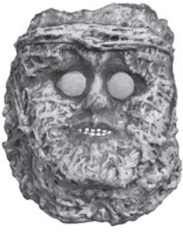
32 MIRABELLE DORS COLLECTION D'ÉVÉNEMENTS, 1986 Resina e materiais recuperados / Resin and recovered materials