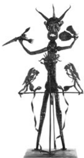
28 AD))) POTEAU DIEUDONNÉ SEM TÍTULO / UNTITLED, n.d. Metal martelado e corrente de bicicleta / Hammered metal and bicycle chain