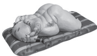
48 MOZART GUERRA A COXA DE JANAINA, 2002 Resina, poliestireno, papel e acrílico / Resin, polystyrol, paper and acrylic