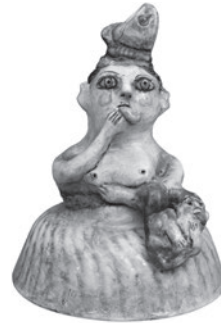
34 REINALDO ECKENBERGER MME ZANR HORIA, n.d. Cerâmica pintada / Painted ceramic