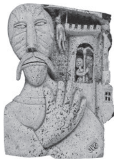
45 JOAQUIM VICENS GIRONELLA LA VENGEANCE DU CHÂTELAIN, 1960 Cortiça sobre madeira / Cork on wood