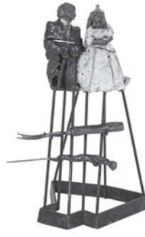
74 JULIEN PERRIER PIÈCE DÉMONTÉE, 2003 Bronze pintado / Painted bronze