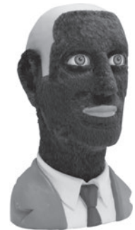
79 ALFREDO GARCÍA REVUELTA RECIÉN AFEITADO, 2002 Gesso e cabelo humano / Plaster and human hair