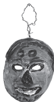
58 JABER (AL-MAHJOUB JABER) SEM TÍTULO / UNTITLED, 1960 Acrílico sobre barro / Acrylic on clay