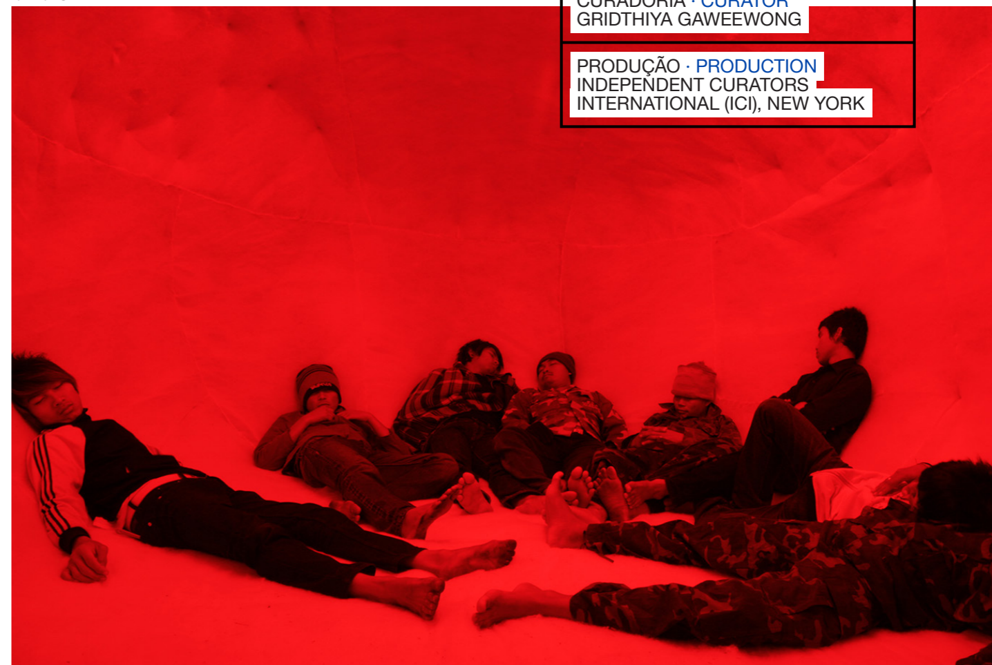
Apichatpong Weerasethakul — Haiku, 2009