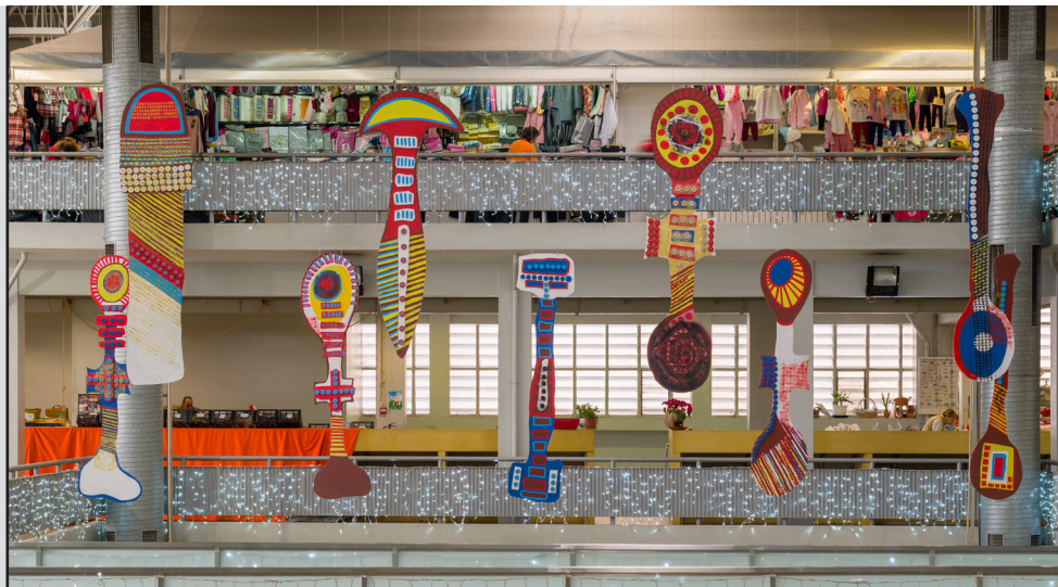
Jorge Dias — Sinais, 2012

Em abril de 2018 o Centro de Arte Oliva iniciou um programa de apresentação de obras de arte em locais públicos de São João da Madeira, tendo como objetivo tornar o contacto e convivência com obras de arte mais alargado à comunidade. Do projeto fazem parte ações concebidas pelo Programa Educativo (ver programa). As obras selecionadas para o projeto são sobretudo esculturas, instalações e fotografias, expostas em locais públicos sendo todas pertencentes à Coleção Norlinda e José Lima, em depósito no Centro de Arte Oliva desde 2013.